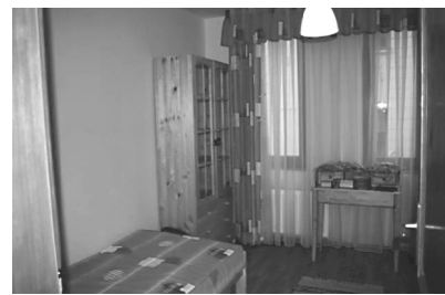
Szállás a vidéki szülőknek Családtámogatás