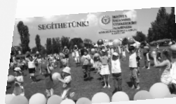
Segítő füzetek gyermekeknek és szülőknek